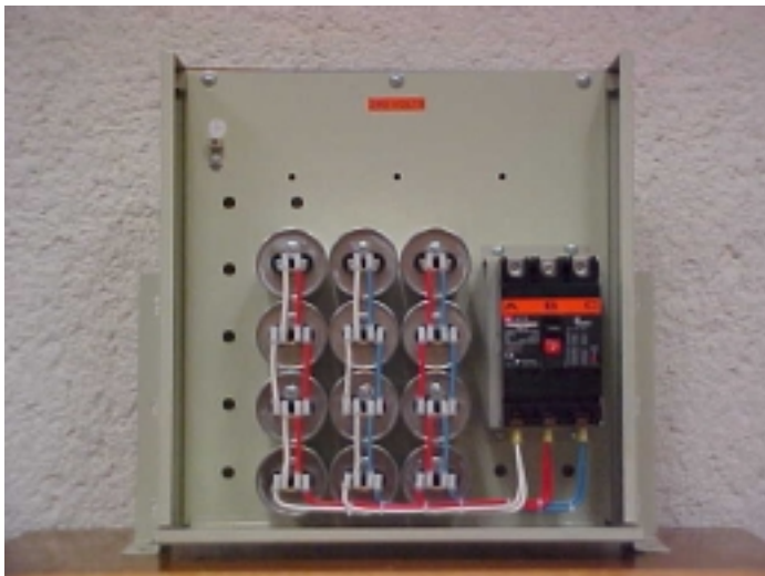
Arreglo de celdas e interruptor termomagnético

El banco de capacitores tiene una protección general a base de un interruptor termomagnético, clase AC3, que cumple con las normas IEC-947-2 y de calidad ISO9001 y ha sido probado en KEMA. El interruptor cuenta con una palanca de accionamiento o tipo lengüeta que sobresale del gabinete de forma que se garantiza la seguridad del operador al conectar o desconectar el banco de capacitores.