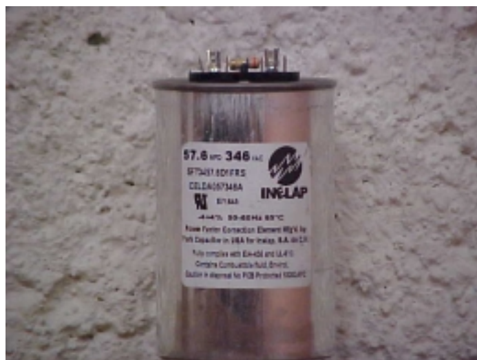
Celda capacitiva con resistencia de descarga

Las celdas capacitivas tienen la aprobación de los laboratorios UL en forma individual y cumplen con las normas ANSI-NEMA y EIA-456. Ésta última requiere que los capacitores sean sometidos 1.25 veces su tensión nominal, a una temperatura de 10 °C arriba de su temperatura de diseño durante 2000 horas y conserven su capacitancia dentro de un rango de \pm 3\% . Esta prueba garantiza una vida del producto por 20 años. A diferencia de la norma IEC que prueba sus unidades a 40 °C por 1000 horas, la norma NEMA garantiza un mejor desempeño de los capacitores. De hecho la norma IEC no permite que la temperatura ambiente sobrepase 40 °C y además esta temperatura no puede conservarse más de 8 horas por cada 24 horas.