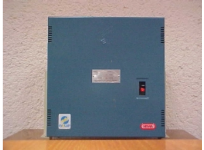
Banco fijo con interruptor para corrección de FP

de sobrecarga o corto circuito. El interruptor termomagnético también tiene la ventaja de permitir la desconexión manual del banco para revisión y mantenimiento.